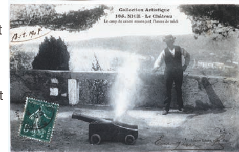
Collection Artistique 188. NICE - Le Château Le coup de canon assourpant l'heure de midi

En lou 1881, lu artificié si caleron sus l'ourouloge de la toure Sant-Francès, pi sus l'ourouloge parlant à la ràdio après la guerra. La pèça d'artilleria fouguet remplaçada mai d'un còu e lou siti d'assendiment trasferit souta la platafourma de l'esplanada. Despi dóu 1886 l'artificié desgancha una boumba de fuèc d'artifici, sounada « marron d'air ». Li tècnica an cambiat mà despi dóu 21 de decembre dóu 1863, una deflagracioun nen fa ressautà cada jour à miejour.