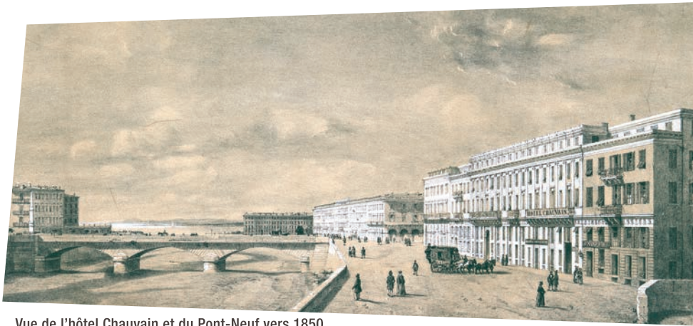
Vue de l'hôtel Chauvain et du Pont-Neuf vers 1850, lithographie, Bibliothèque nationale de France